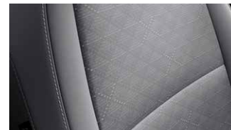
LX szürke szövet