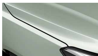
Urban Green (URG)