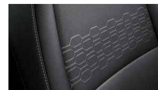
EX fekete szövet