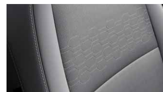
EX szürke szövet