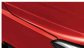
Signal Red (BEG)