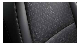
LX fekete szövet