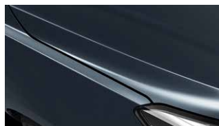
Smoke Blue (EU3)