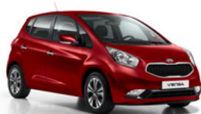
New Infra Red (AA9)