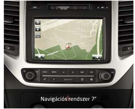
Navigációs rendszer 7"