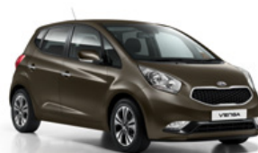
Sand Track (D5U)