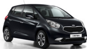
Black Pearl (1K)