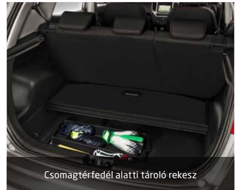
Csomagtérfedél alatti tároló rekesz