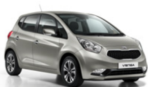
Sirius Silver (AA3)