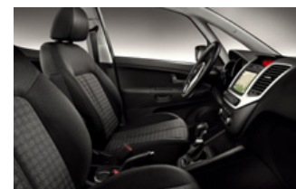
LX fekete szövet