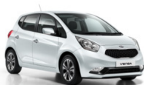
Casa White (wD)