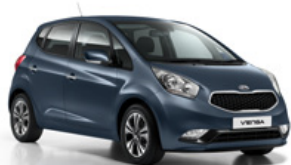
Planet Blue (D7U)