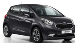
Dark Gun Metal (E5B)